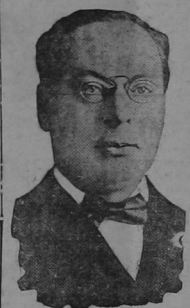
MR. THOMAS R. MARSHALL

Candidato a la Vicepresidencia por el Partido Demócrata que ha desempeñado ya durante el período de 1913-1917.