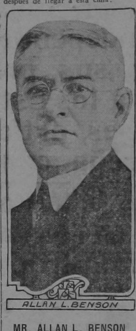
MR. ALLAN L. BENSON

Candidato a la Presidencia por el Partido Socialista. Es un conocido orador y escritor que reside en Yonkers, New York, y que calcula su fuerza en dos millones de votos en toda la Unión.